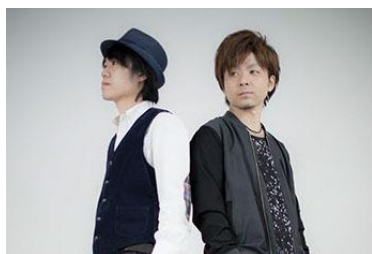
秋風センチメンタル